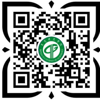
东莞理工学院学生缴费系统